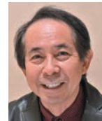
大西みつぐ 氏 写真家 公益社団法人日本写真家協会会員