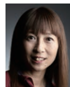
米美知子 氏 写真家

日本フォトコンテスト協会代表理事 公益社団法人日本写真家協会会員 公益社団法人日本写真家協会会員